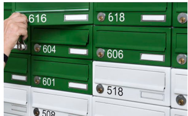
Renz Basic+ leveret til Grundfoss Kollegiet, Ørestadens Plejecenter og Banebo i Viborg