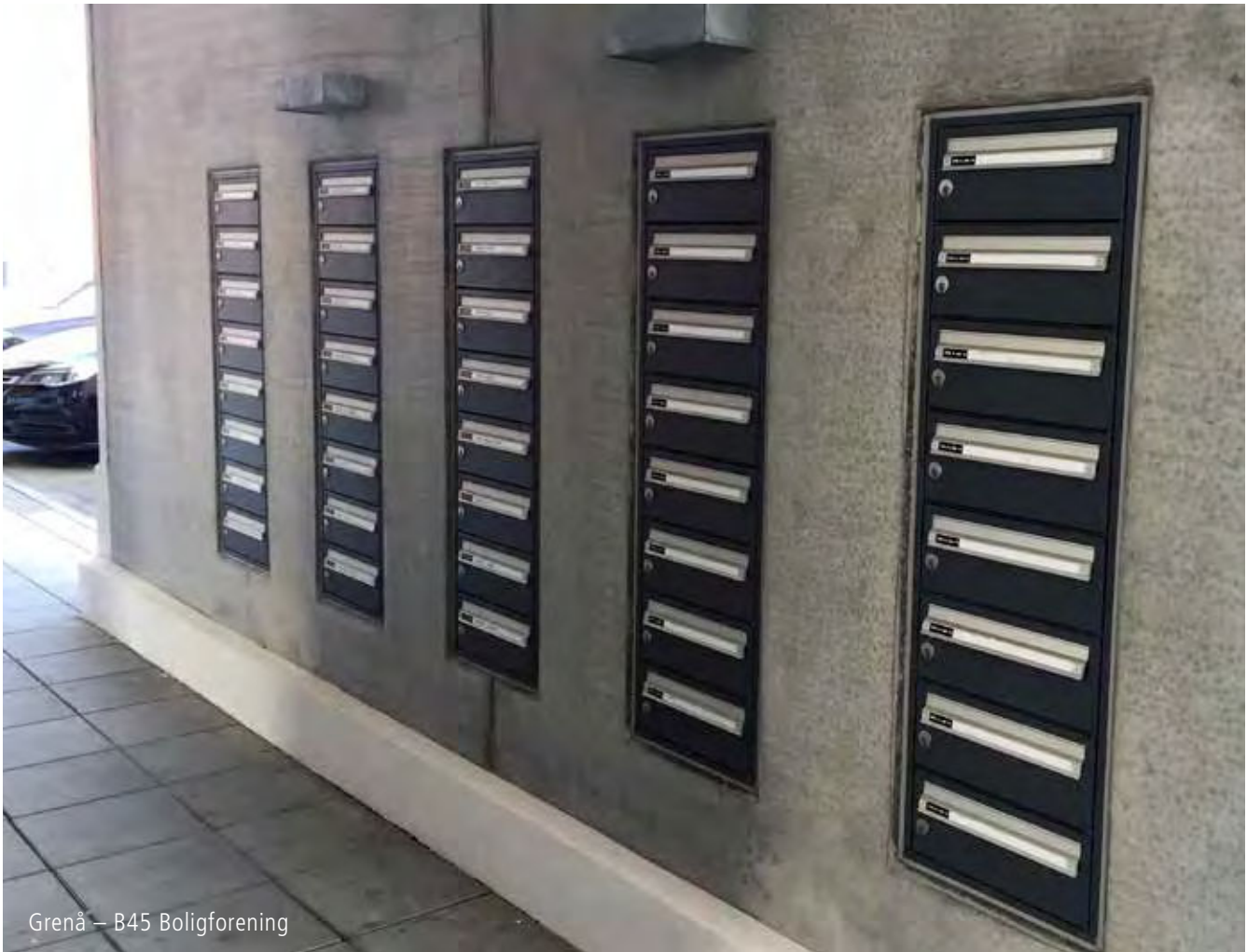
Grenå – B45 Boligforening