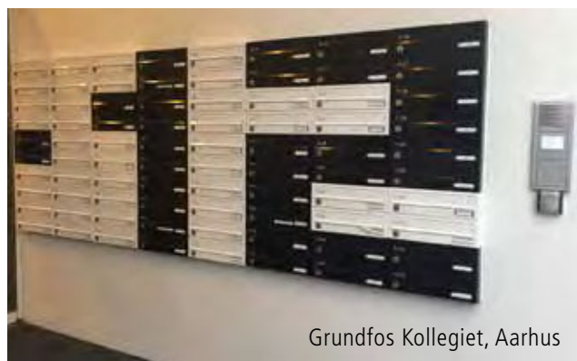
Grundfos Kollegiet, Aarhus