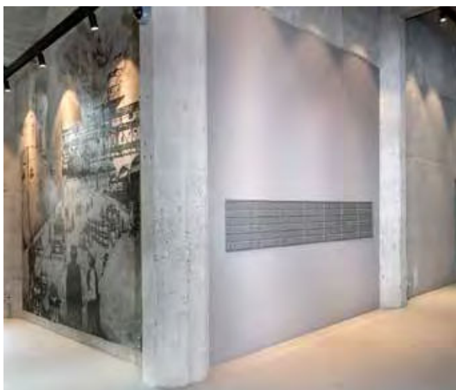
Renz Plan, RAL 9007, The Silo, København