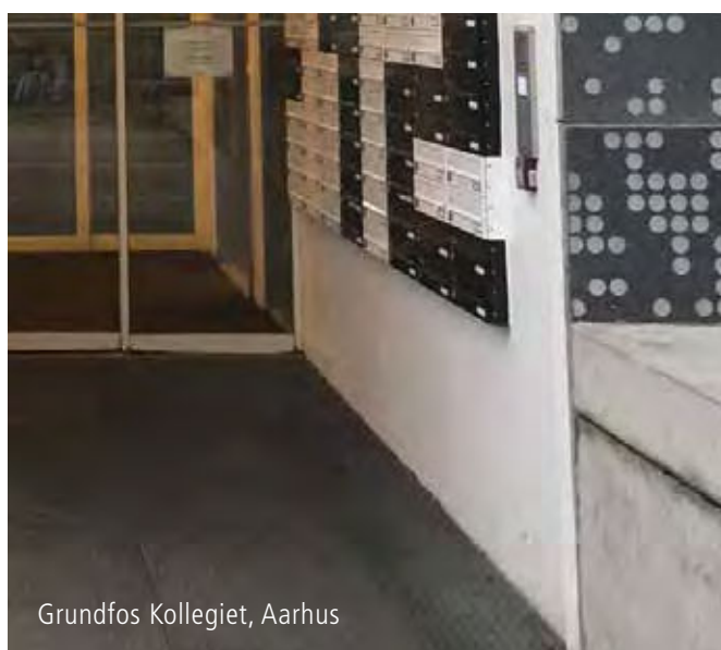
Grundfos Kollegiet, Aarhus