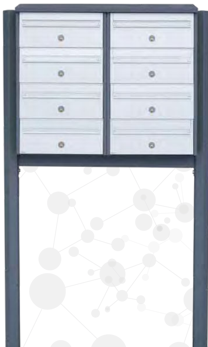
Model 700: Kabinet i hvid RAL 9016 med front i aluminium